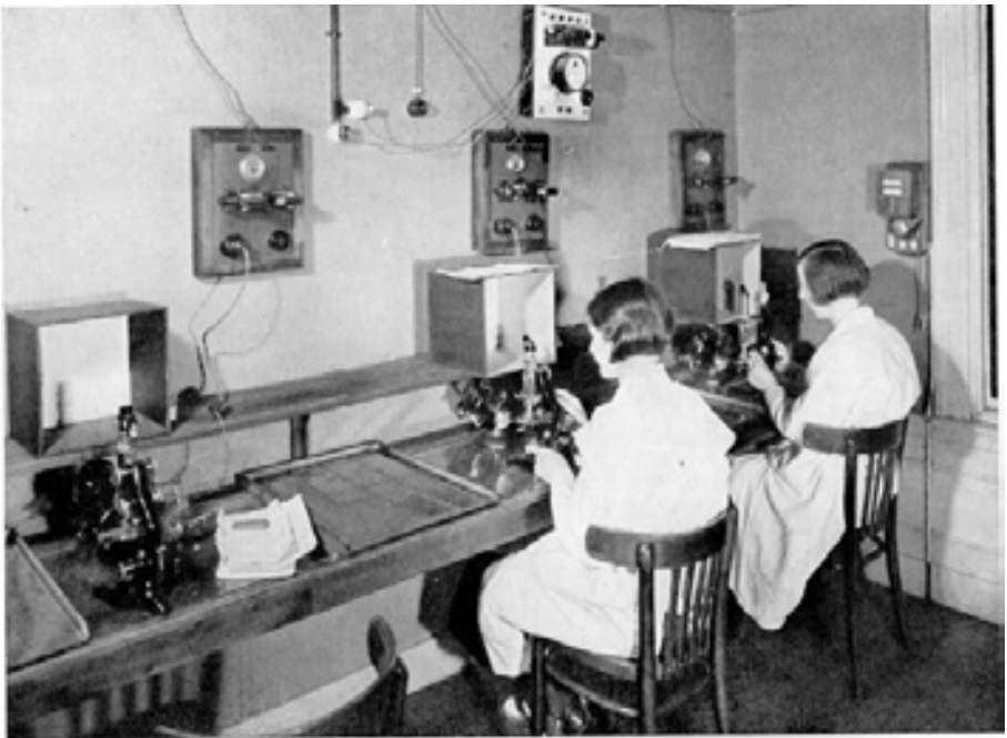
PROJECTIEKAMER VOOR MICROSCOPISCH ONDERZOEK

ontstond in 1914 de Vereniging voor Melkcontrole, waarvan boeren en fabrieken lid konden worden. 19 Friese zuivelfabrieken sloten zich direct aan en onderwierpen zich aan controle op hun bepalingen, uitgevoerd door een laboratorium in Leeuwarden. Snel groeide hun aantal. Ook elders werden ten behoeve van particuliere zuivelfabrieken en slijtersorganisaties melkcontrolestations opgericht, o.a. door de VVZM.